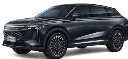
Carbon Crystal Black 20 000 Kč