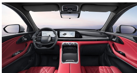
Červený interiér 0 Kč