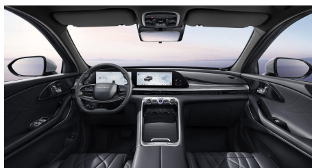
Černý interiér 30 000 Kč