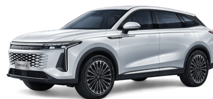
Khaki White 20 000 Kč