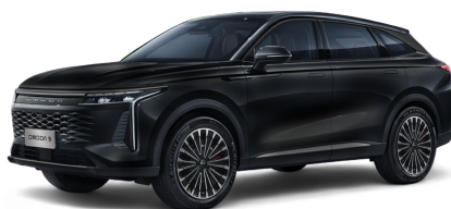
Matte Black 40 000 Kč