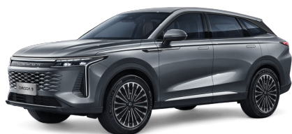
Matte Gray 30 000 Kč