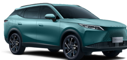
Misty Green 20 000 Kč