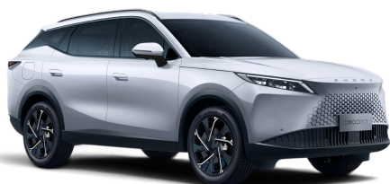
Khaki White 0 Kč