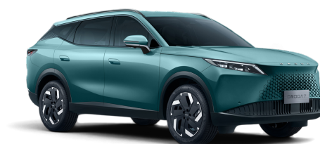
Misty Green 20 000 Kč