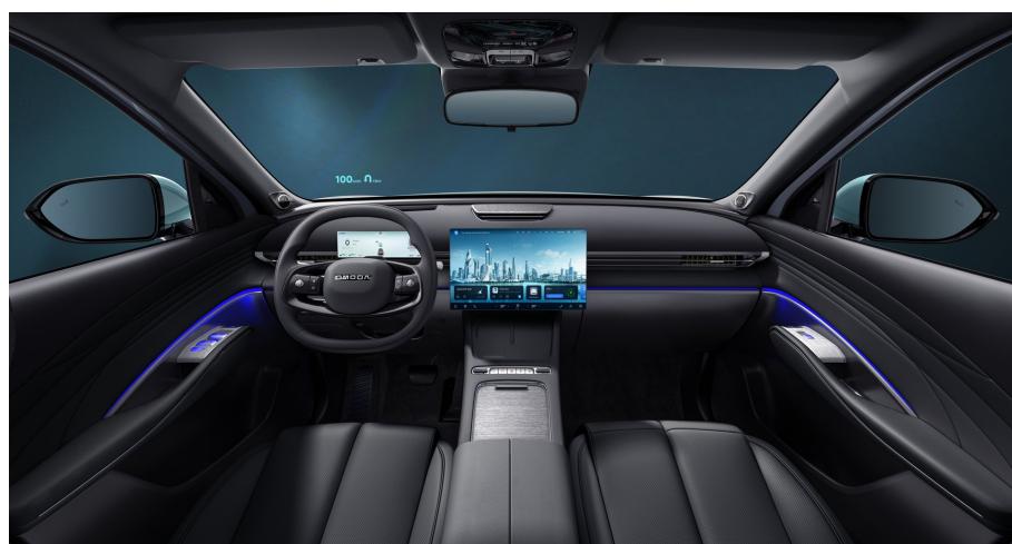
Černý interiér 0 Kč