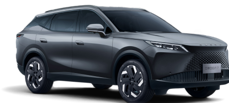
Matte Gray 30 000 Kč