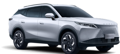
Khaki White 0 Kč