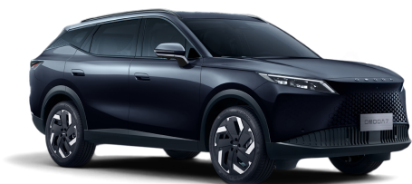
Carbon Black 20 000 Kč