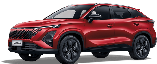
Krvavě červená 0 Kč