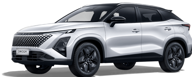
Uhlíkově černá a khaki bílá 18 000 Kč