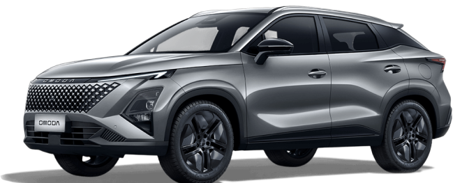
Fantomově šedá 13 000 Kč