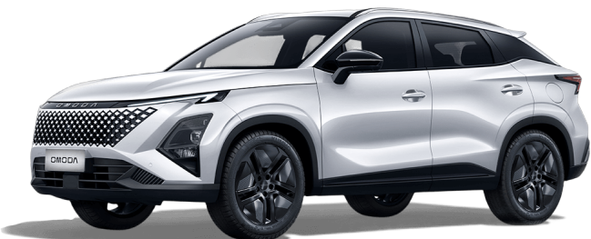
Khaki bílá 13 000 Kč