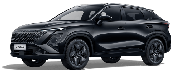
Uhlíkově černý krystal 13 000 Kč