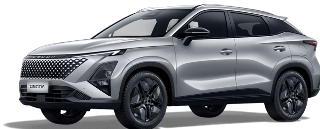
Kovově stříbrná 13 000 Kč