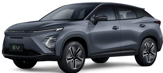
Fantomově šedá 13 000 Kč