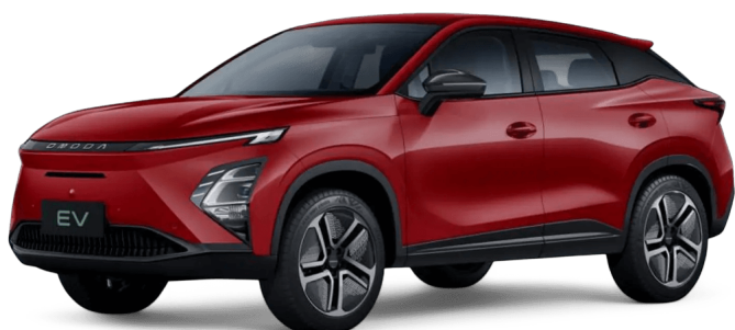
Krvavě červená 0 Kč