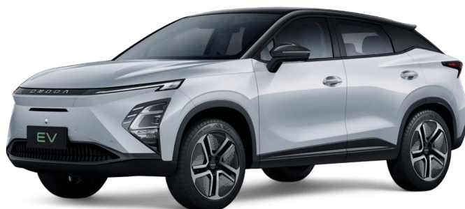
Uhlíkově krystalická černá a khaki bílá 18 000 Kč