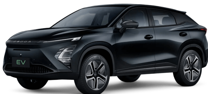
Uhlíkově krystalická černá 13 000 Kč