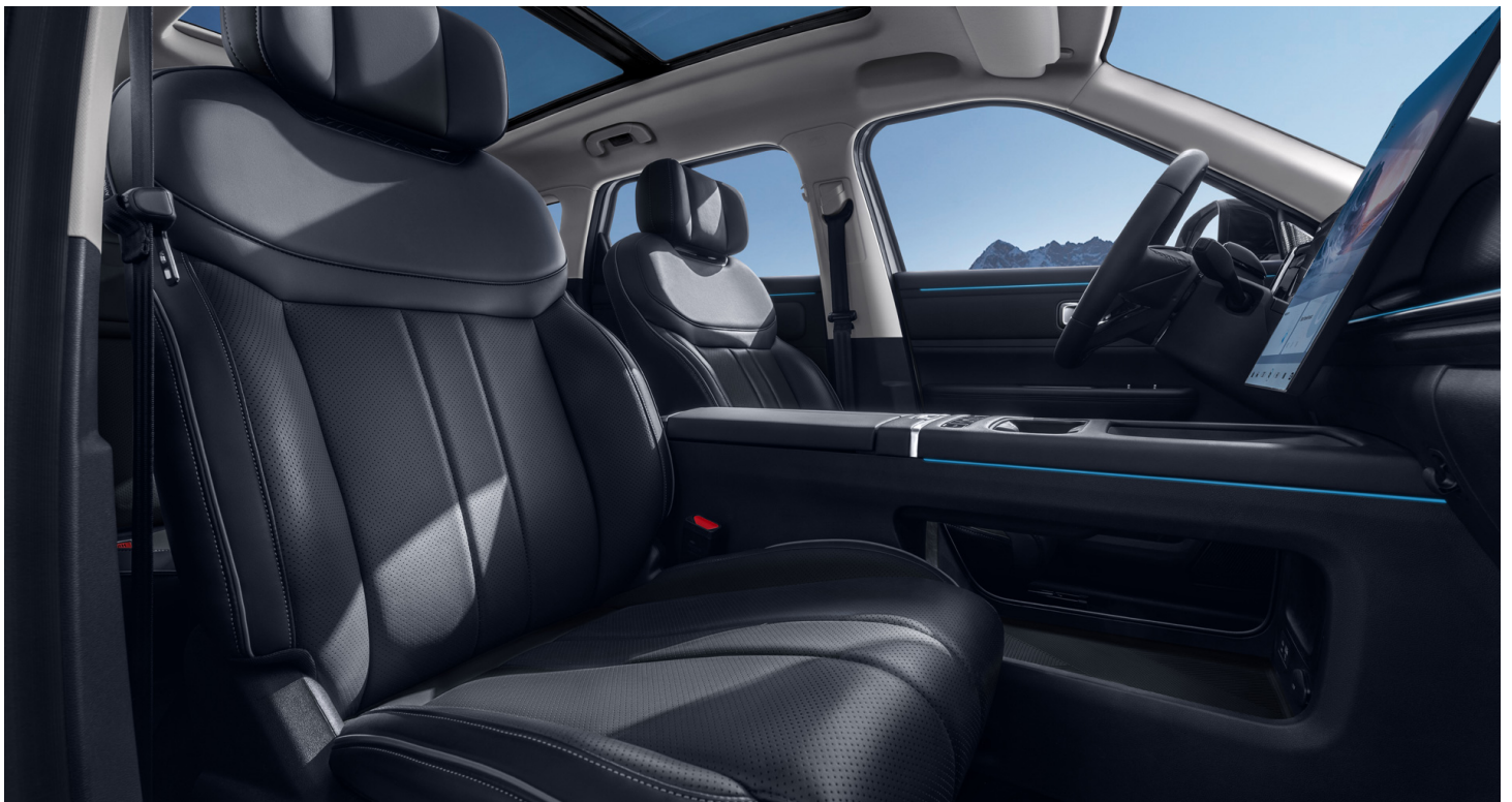
Černý interiér 0 Kč