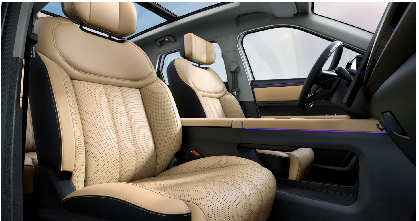
Hnědý interiér 15 000 Kč