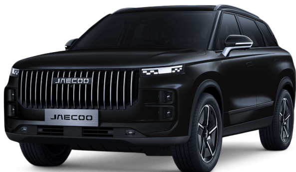
Uhlíkově krystalická černá 15 000 Kč