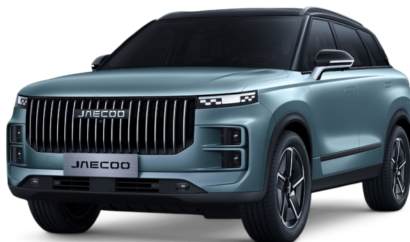
Uhlíkově krystalická černá a Olivově šedá 20 000 Kč