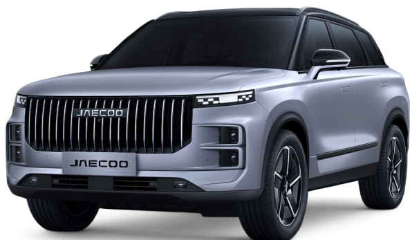
Uhlíkově krystalická černá a Měsíční stříbrná 20 000 Kč