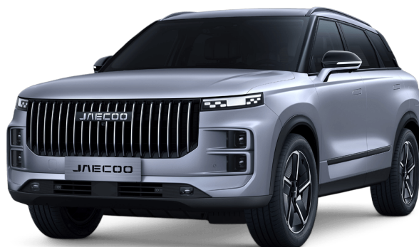
Měsíční stříbrná 15 000 Kč