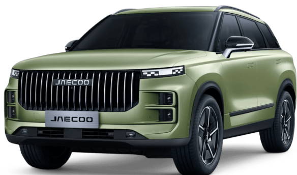
Modelová zelená 15 000 Kč