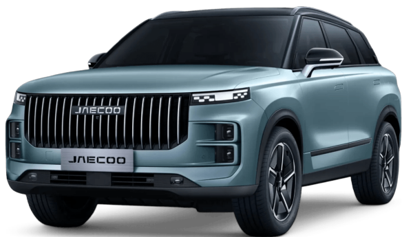
Uhlíkově krystalická černá a Olivově šedá 20 000 Kč