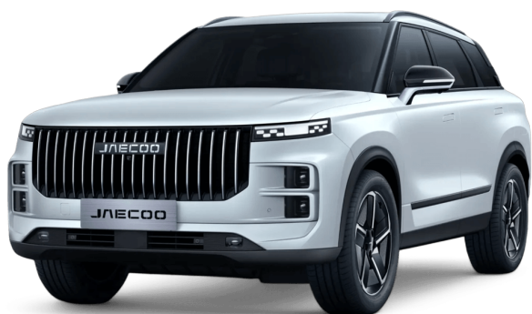
Khaki bílá 0 Kč