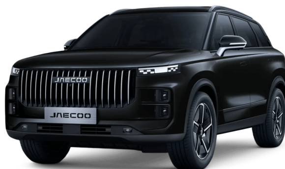
Uhlíkově krystalická černá 15 000 Kč