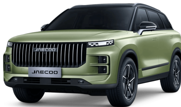
Uhlíkově krystalická černá a Modelová zelená 20 000 Kč