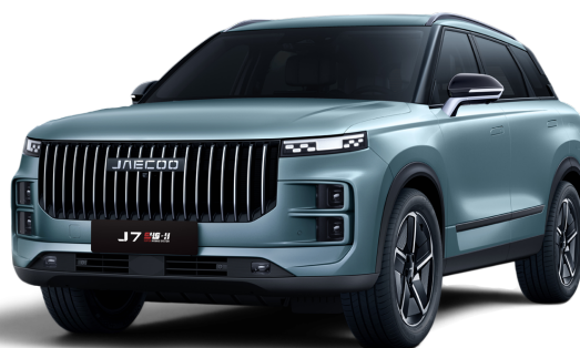
Šedá 15 000 Kč