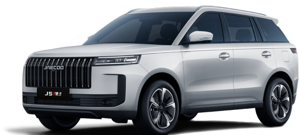
Snowy White 14 000 Kč