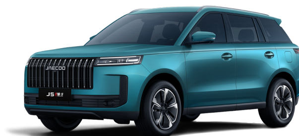
Alpine Green 14 000 Kč