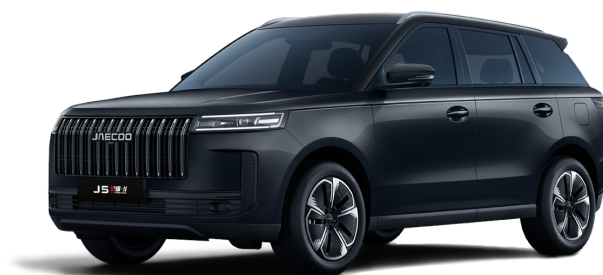
Canyon Black 14 000 Kč