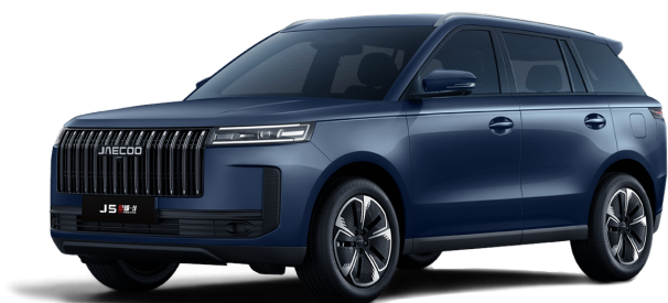
Glacier Blue 0 Kč