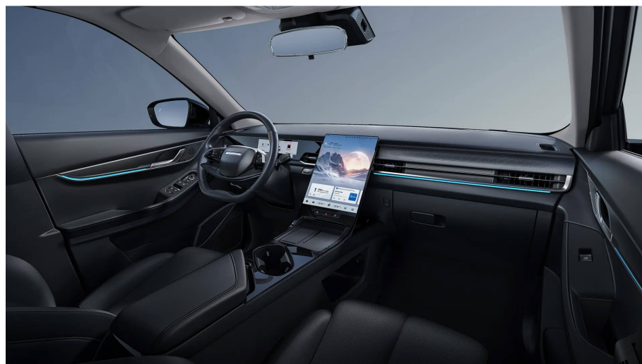
Černý interiér 0 Kč