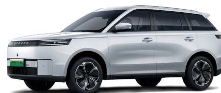
Snowy White 14 000 Kč