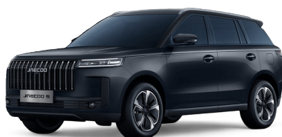
Canyon Black 14 000 Kč