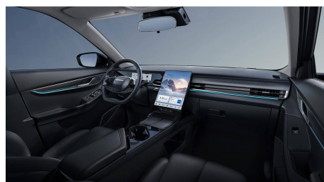
Černý interiér 0 Kč