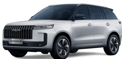
Snowy White / černá střecha 19 000 Kč