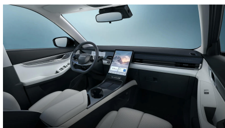
Světle šedý interiér 10 000 Kč