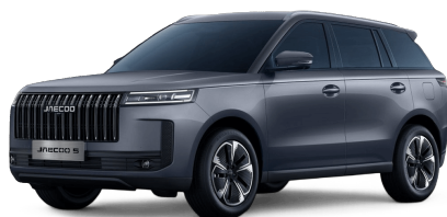
Zircon Gray 14 000 Kč