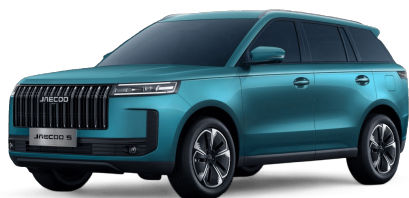
Alpine Green 14 000 Kč