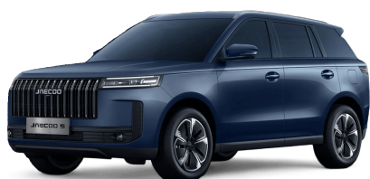
Glacier Blue 0 Kč