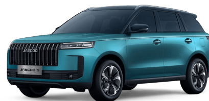
Alpine Green / černá střecha 19 000 Kč