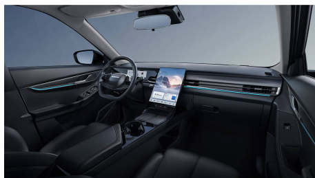
Černý interiér 0 Kč