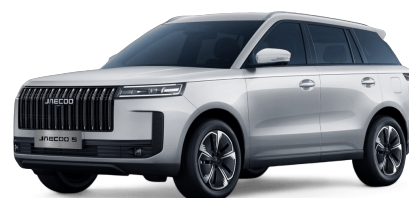
Snowy White 14 000 Kč